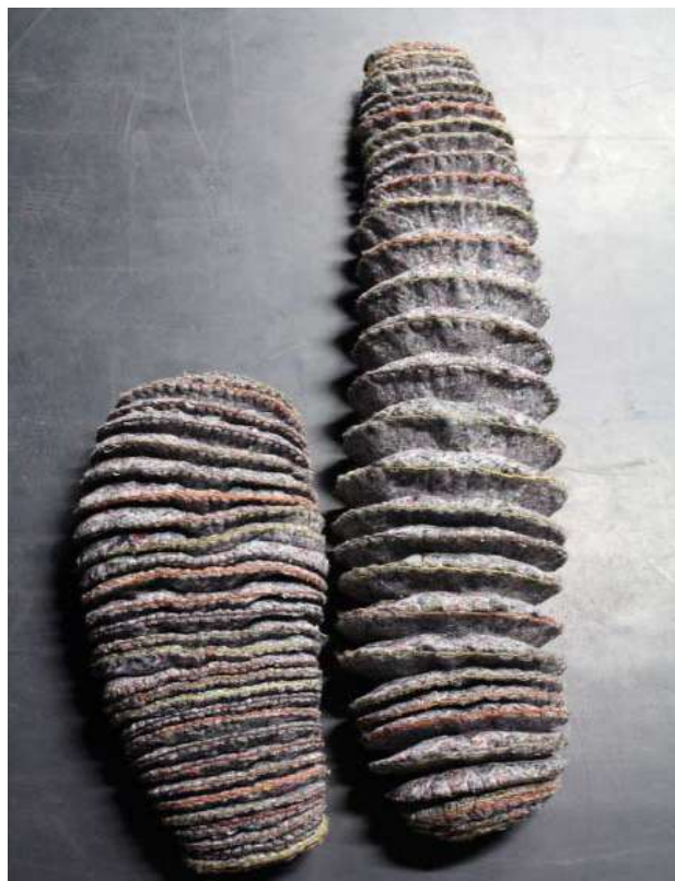
Myriam Colin, Habitats 2 , 2012, Volumes en feutre