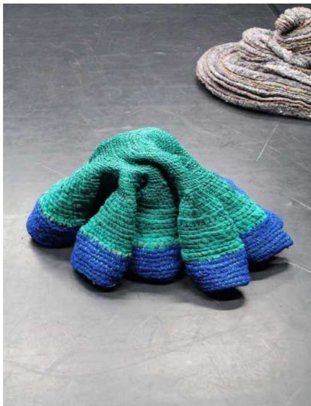
Myriam Colin, Objet évolutif , 2017/18 Volume en filets

Il a également bénéficié de l'aide de l'Agence culturelle Grand Est au titre du dispositif « Tournée de coopération ».